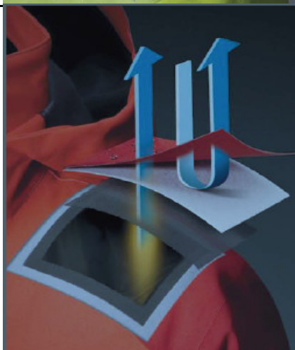
Gore-Tex Soft Shell

GORE-TEX® Pro Shell ist die erste Wahl für Oberbekleidung in extremen Situationen. GORE-TEX® Membrane wird dazu dauerhaft mit einem äußerst robusten Oberstoff und einem widerstandsfähigen und dabei wasserdampfdurchlässigen Futterstoff zu einem Laminat verarbeitet.