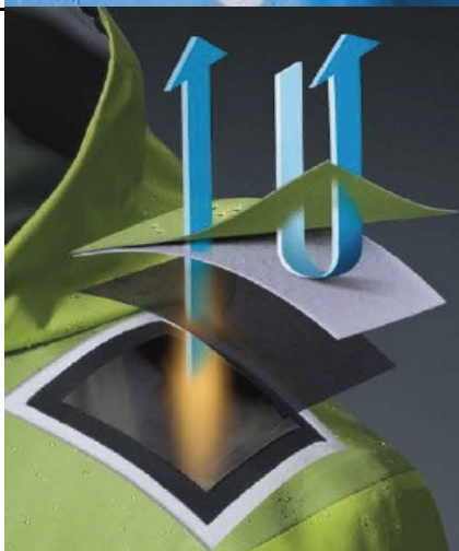
Gore-Tex Pro Shell

Bei den GORE-TEX® Paclite® Modellen wird die Membrane mit einem Oberstoff verbunden und einer dünnen, Öl abweisenden Schutzschicht versehen, ohne einen Futterstoff zu benötigen – so wird Gewicht gespart.